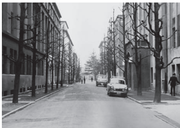
図4 創設期の生物学専修が設けられた旧4号館 (生物学専修1期生卒業アルバム, 6号館生物準備室蔵)

つぎに1年生から4年生まで揃い、学部が完成した4期生では、安増研究室で博士課程を修了し、