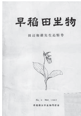
図2 「早稲田生物」9号（1962, 溝口蔵）